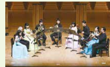
2018.5.25 管打楽器シリーズ モーリス・ブルグを迎えて