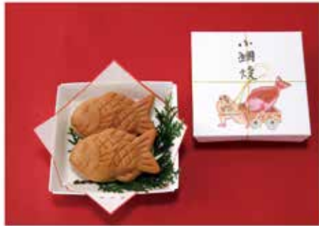
お祝い事に小鯛焼