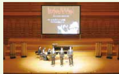
2018.6.23 藝大プロジェクト バーンスタインのアメリカ