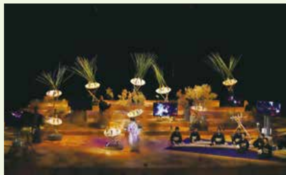
2018.8.5 サマーアーツ・ジャパン2018