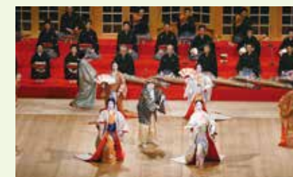
2018.9.13 和楽の美 安土桃山〜信長・秀吉英雄譚