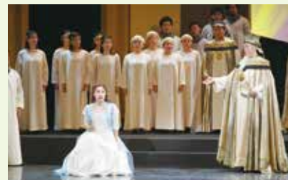
2018.10.6 藝大オペラ定期 モーツァルト「魔箱」