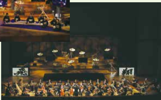
2018.8.5 サマーアーツ・ジャパン2018