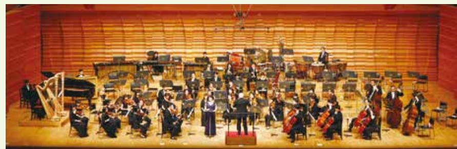
2018.6.1 創造の杜 作曲家 ヴィトル・ルトスワフスキ