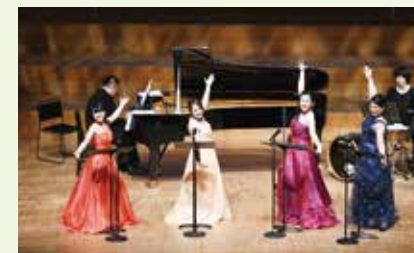
2018.6.23 藝大プロジェクト バーンスタインのアメリカ