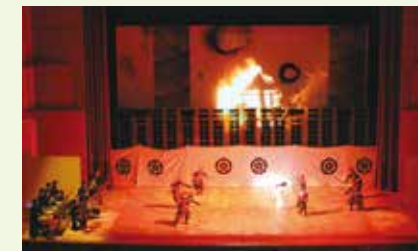
2018.9.13 和楽の美 安土桃山〜信長・秀吉英雄譚