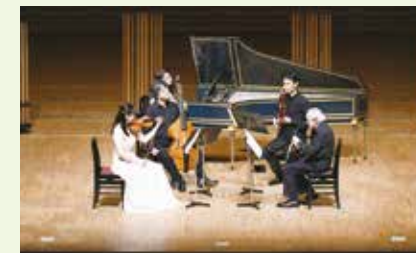
2018.5.25 管打楽器シリーズ モーリス・ブルグを迎えて