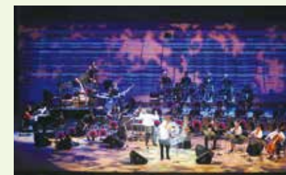
2017.7.29 ジャズ in 藝大