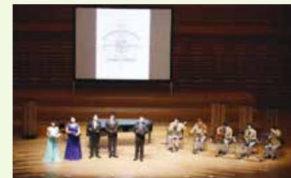
2018.6.23 藝大プロジェクト バーンスタインのアメリカ