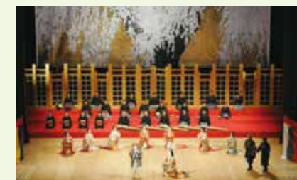
2018.9.13 和楽の美 安土桃山〜信長・秀吉英雄譚